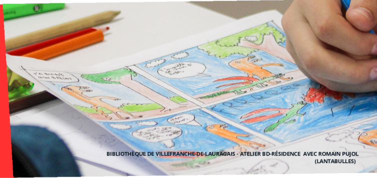
BIBLIOTHÈQUE DE VILLEFRANCHE-DE-LAURAGAIS - ATELIER BD-RÉSIDENCE AVEC ROMAIN PUJOL (LANTABULLES)